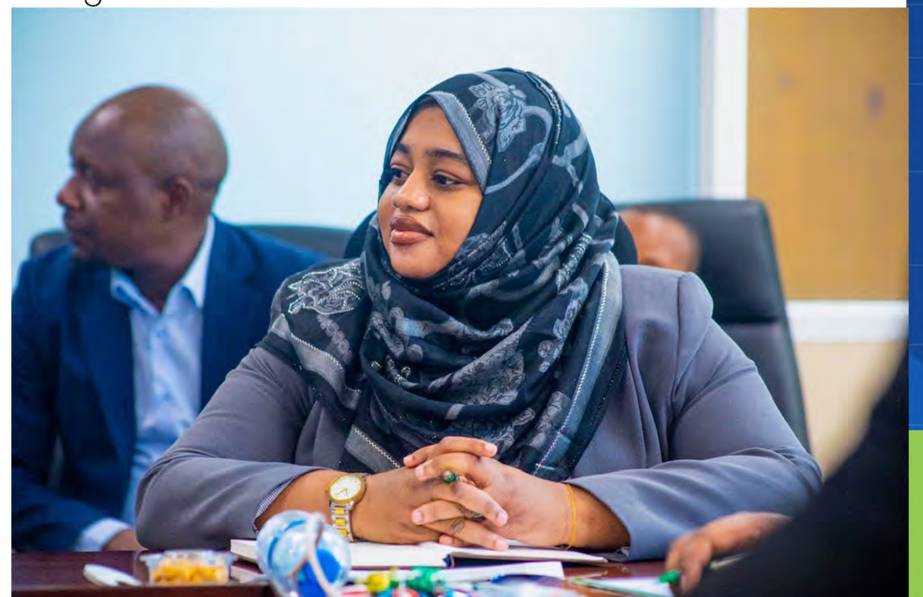
Naibu Waziri wa Nchi, Ofisi ya Waziri Mkuu – Kazi, Ajira na Mahusiano, Mhe. Rahma Kisuo akizungumza wakati wa ziara hiyo.

Kwa upande wake, Naibu Waziri wa Nchi, Ofisi ya Waziri Mkuu – Kazi, Ajira na Mahusiano, Mhe. Rahma Kisuo, aliihamasisha Menejimenti ya Mfuko huo kuimarisha utoaji wa elimu kwa umma kuhusu majukumu na huduma zinazotolewa na WCF, ili kuongeza uelewa na ushiriki wa waajiri wengi zaidi.