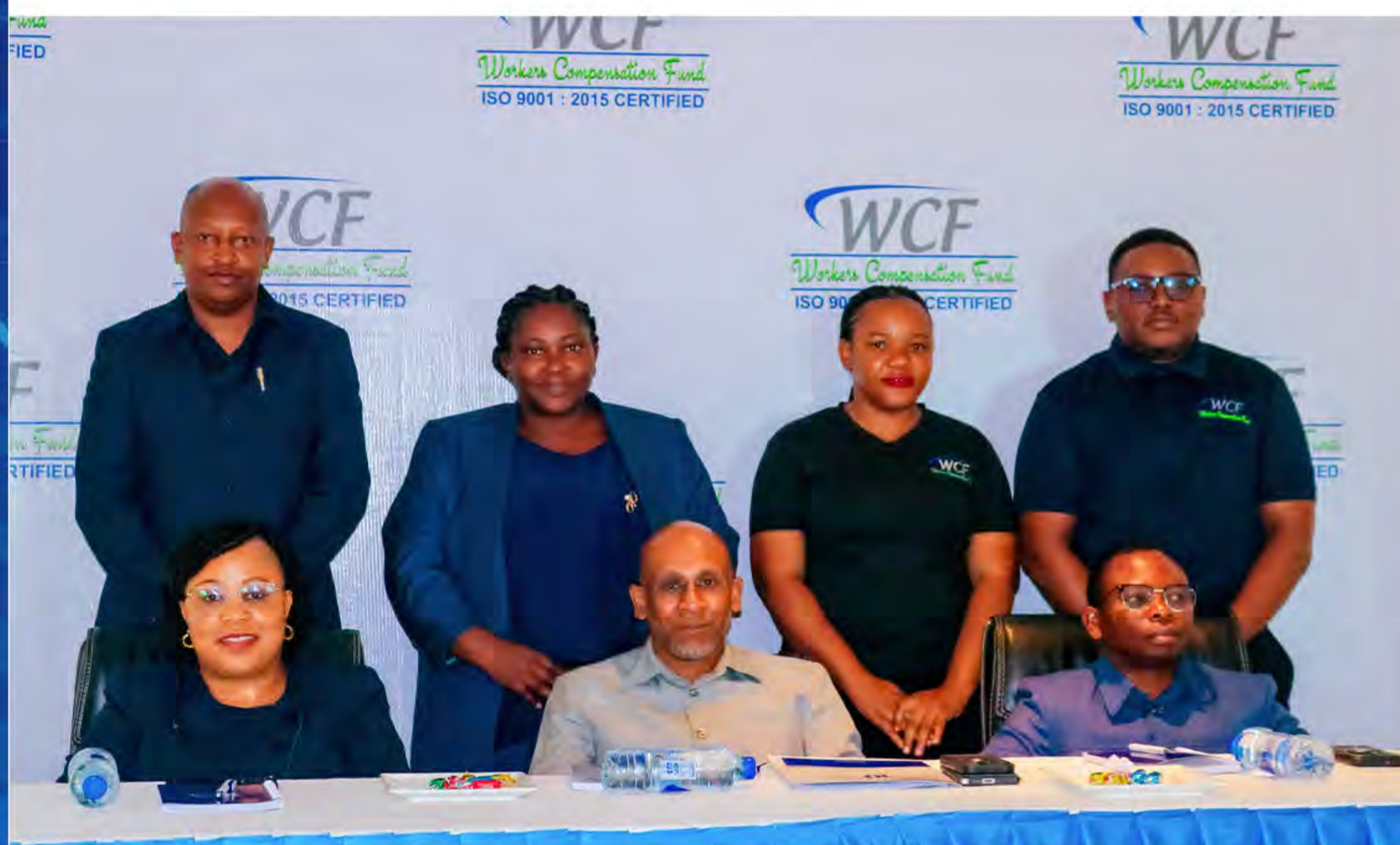
Watoa mada wakati wa mafunzo kwa maafisa rasilimali watu na usalama kazini

Mfuko wa Fidia kwa Wafanyakazi (WCF) umeendelea kutoa mafunzo kwa Maafisa Rasilimali Watu na Maafisa Usalama na Afya Mahali pa Kazi kutoka mikoa ya kanda ya Pwani na Kusini, lengo likiwa ni kuongeza uelewa kuhusu masuala ya fidia pamoja na usalama na afya kazini. Mafunzo hayo yamefanyika mjini Mtwara kuanzia tarehe 11 hadi 12 Novemba 2025.