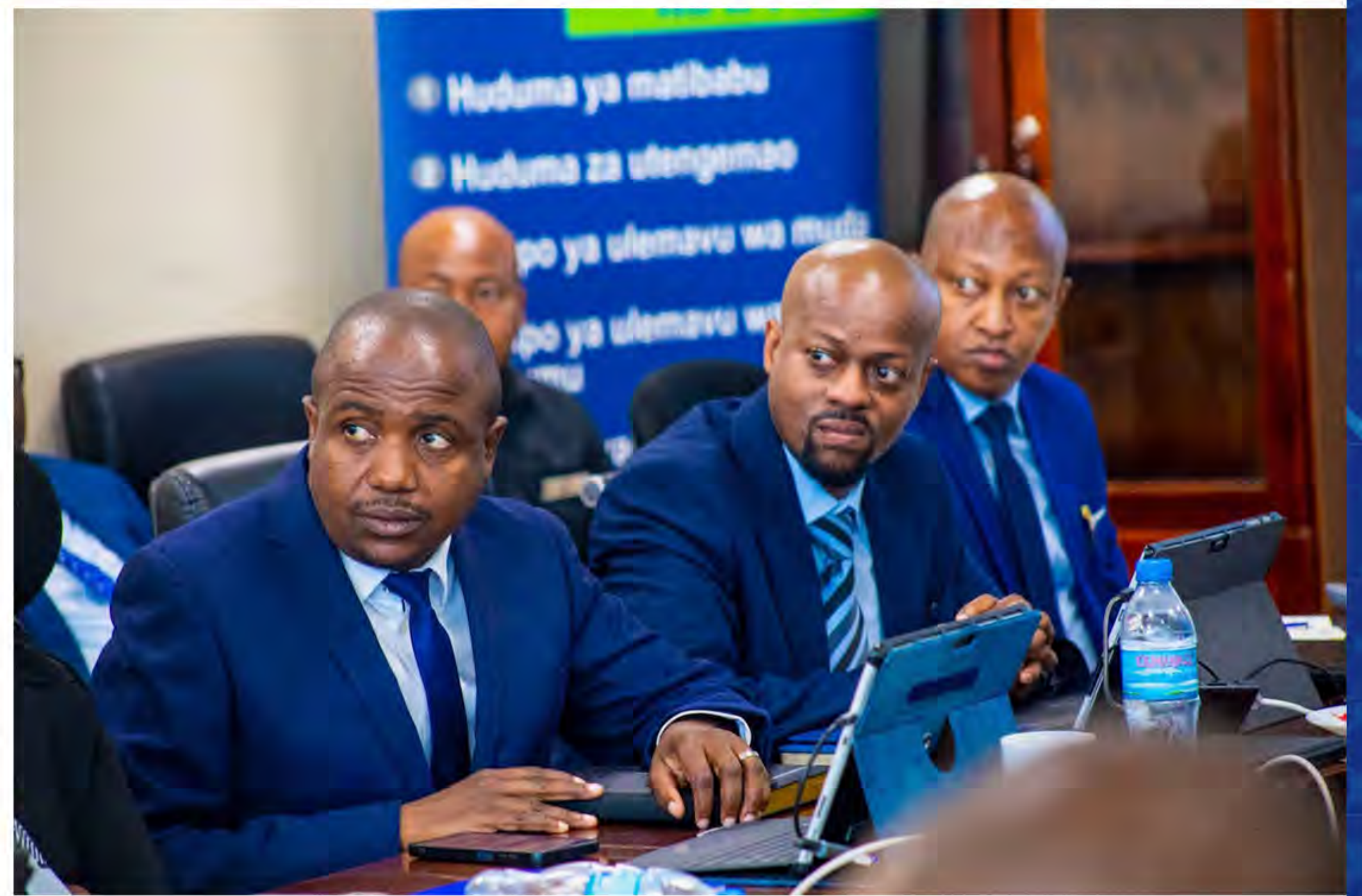
Baadhi ya Wajumbe wa Menejimenti ya WCF wakimsikiliza Mh. Waziri Sangu

Ziara hiyo imeonesha dhamira ya Serikali ya kuendelea kuimarisha taasisi zake ili ziweze kutoa