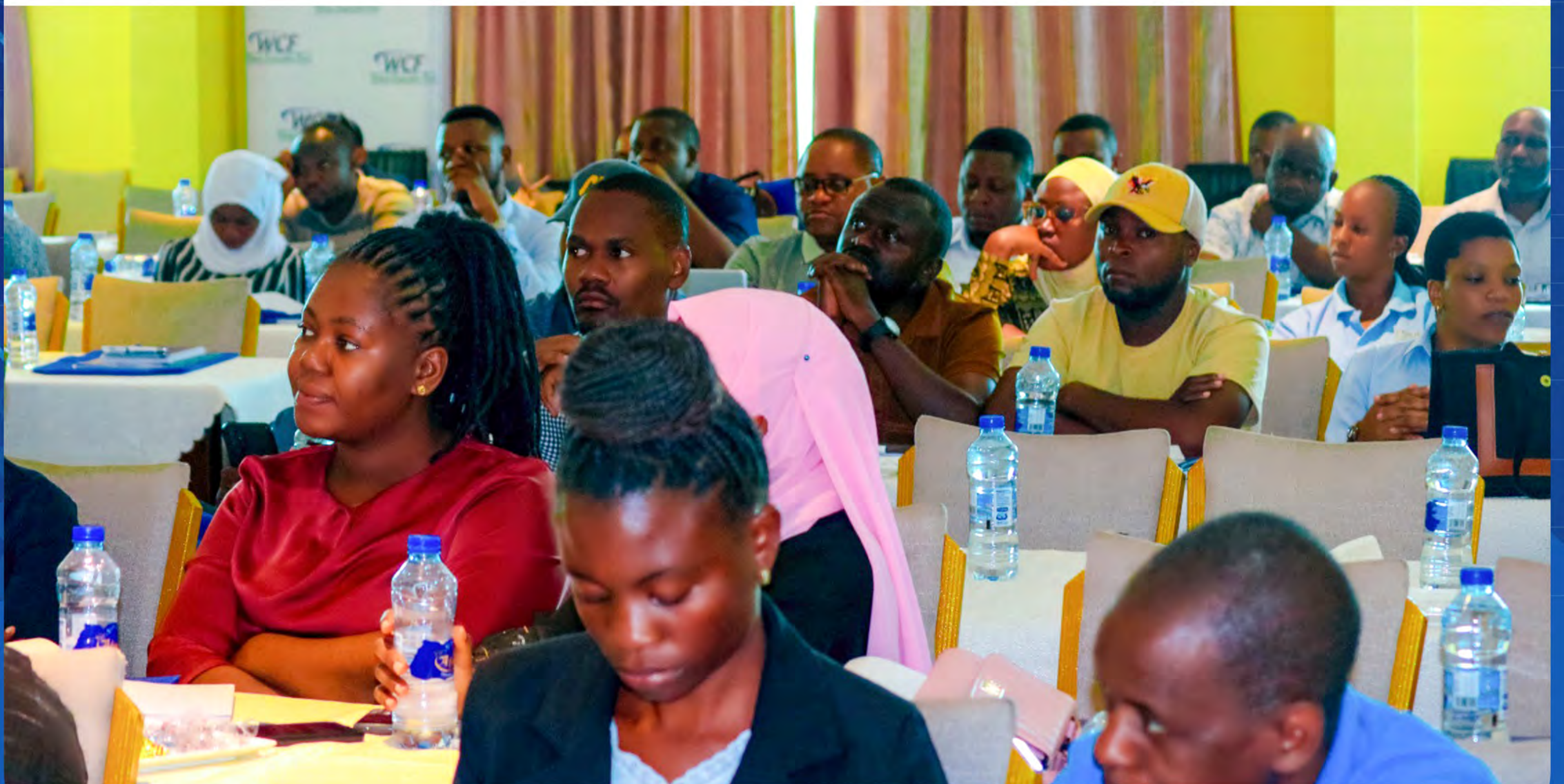
Baadhi ya washiriki wakifuatilia mafunzo

Katika mafunzo hayo, mada mbalimbali ziliwasilishwa ikiwemo huduma zinazotolewa na WCF, hatua sahihi za kuwasilisha madai ya fidia, pamoja na matumizi ya mifumo ya kidijitali ya Mfuko huo ikiwemo WCF Online Portal na WCF Mkononi App, ikiwa ni sehemu ya jitihada za Mfuko kuboresha utoaji wa huduma kwa waajiri na wafanyakazi nchini.